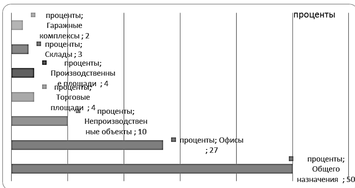
Рисунок 1. Доли сегментов в коммерческой недвижимости

Как видим, здесь лидируют площади общего назначения (50%), офисы (27%) и непроизводственные объекты (10%).