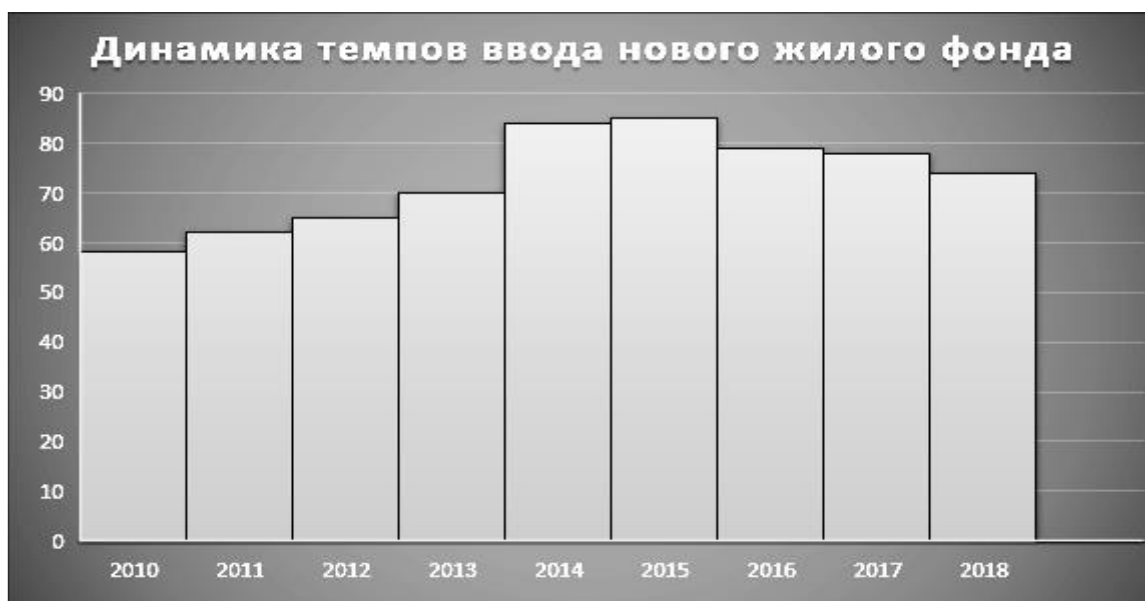
Рисунок 2. Динамика темпов ввода нового жилого фонда, млн. кв.м.

Несмотря на явные ухудшения в этом сегменте четвертый квартал отличился высокими темпами по скупке недвижимости, включая жилые и коммерческие объекты, что несколько противоречит информации, приводимой ниже.