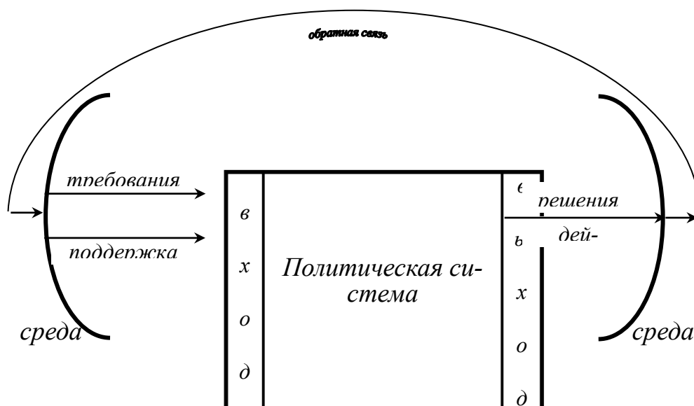
Таб. 1. Модель политической системы по Д. Истону

к модели политической системы Д. Истона и, используя его понятийный аппарат, Алмонд подчёркивает, что «под политическим, или «входным» процессом мы подразумеваем поток требований общества к политике и конвертацию этих требований в авторитетную политику (См: таблицу 1). Прежде всего, в этот «входной» процесс вовлечены политические партии, группы интересов и средства массовой коммуникации. Под административным процессом, или процессом на «выходе» мы понимаем процесс, посредством которого политика осуществляется и подкрепляется. В этот процесс прежде всего включены такие структуры, как бюрократии и суды» 1 . Следовательно, политика это процесс на входе в политическую систему, это процесс выдвижения требований, это неупорядоченный, неорганизованный, не рационализированный процесс, это процесс согласования интересов, процесс, предваряющий принятие решения. Политика – это своего рода эквилибристика, это искусство удержания равновесия в постоянно изменяющемся мире.