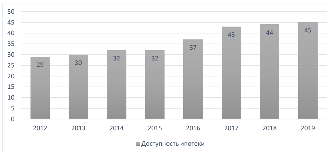
Рисунок 1 – Доступность ипотеки для населения России за период 2012-2019 гг., в % [5]

Следующей особенностью развития рынка ипотечного кредитования жилой недвижимости в Российской Федерации выступает увеличение уровня доступа семей к продуктам банковского ипотечного кредитования, что является крайне важным обстоятельством (см. рисунок 1).